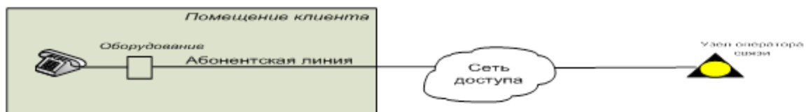
Схема предоставления E1